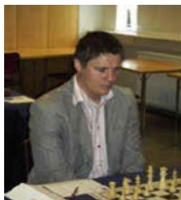
Bragi Þorfinnsson Alþjóðl. m. (2417)